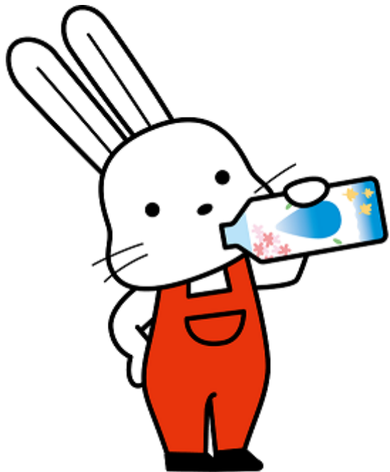
福島市観光 PR キャラクター ももりん