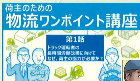
【荷主の皆様向け動画】

また、令和3年6月には、新たなコンテンツとして、荷主企業向けのショートセミナー形式の 連載動画「荷主のための物流ワンポイント講座」 を掲載しています。