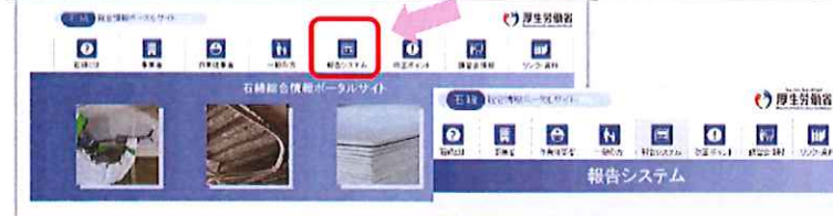
「石綿総合情報ポータルサイト」のホームページ画面（パソコンでの画面）