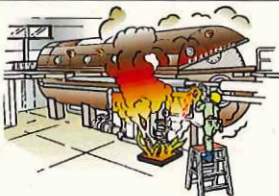
参考図（職場の安全サイトから抜粋）

工事現場で溶接作業を行っていたところ、溶接火花が飛んで、近くに置いていた塗装液に引火し、作業者が火傷した。