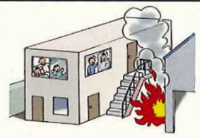
参考図（職場の安全サイトから抜粋）

工場内の休憩所で休憩していたところ、工場建屋で漏電による火災が発生し、避難口が分からずに逃げ遅れて、一酸化炭素中毒になった。