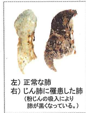
左) 正常な肺 右) じん肺に罹患した肺 (粉じんの吸入により肺が黒くなっている。)

現在、じん肺を治す根本的な治療がないため、じん肺にかからないための措置として、粉じんの発生源対策、局所排気装置等の適正な稼働、呼吸用保護具の適正な着用などにより、粉じんへの「ばく露防止対策」を徹底することが重要です。